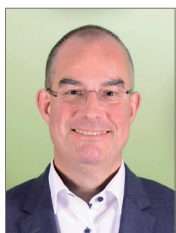
Wer soll das bezahlen?

Die AHV wird nach dem sogenannten Umlageverfahren finanziert: Sie gibt in etwa so viel aus, wie sie jährlich einnimmt. Die Leistungen werden hauptsächlich durch Beiträge von Versicherten und Arbeitgebenden finanziert, ergänzt durch Anteile des Bundes.