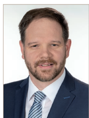
Une fin sans frayeur

C'est dans le but d'optimiser l'attention portée aux clients que je m'étais présenté en tant que nouveau directeur de la Fondation de prévoyance dans la 47 e édition de la fenêtre Spida. Environ cinq ans plus tard, le moment est venu pour moi de faire mes adieux à la Spida, de dire «au revoir» et de vous remercier tous de notre précieuse collaboration. C'est le cœur lourd que je quitte la Spida, où j'ai travaillé avec grand plaisir. Mais la possibilité de prendre la direction de la caisse de pension de mon canton de résidence, représente pour moi une opportunité professionnelle unique.